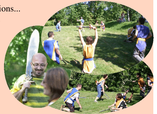
Le Troll Ball : un jeu d'équipe, fédérateur par excellence !